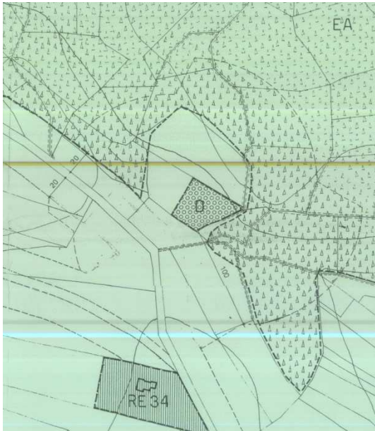
Stralcio Tav.D3 – Scala 1:1.500 Cartografia Vigente